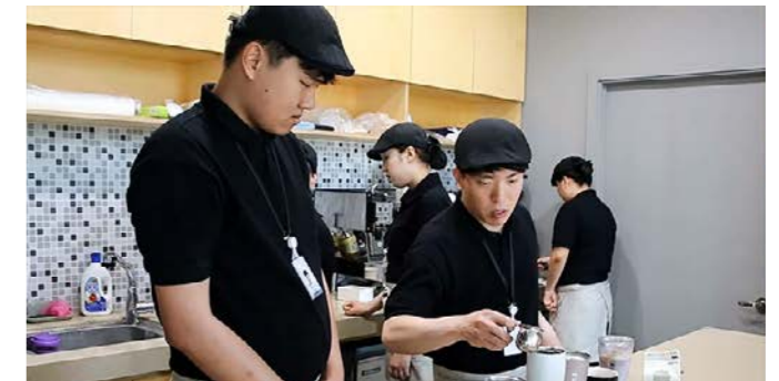
SK이노베이션의 자회사형 장애인 표준사업장 ‘행복키움’이 운영하는 ‘카페 행복’에서 장애인 근로자들이 바리스타 교육을 받고 있는 모습